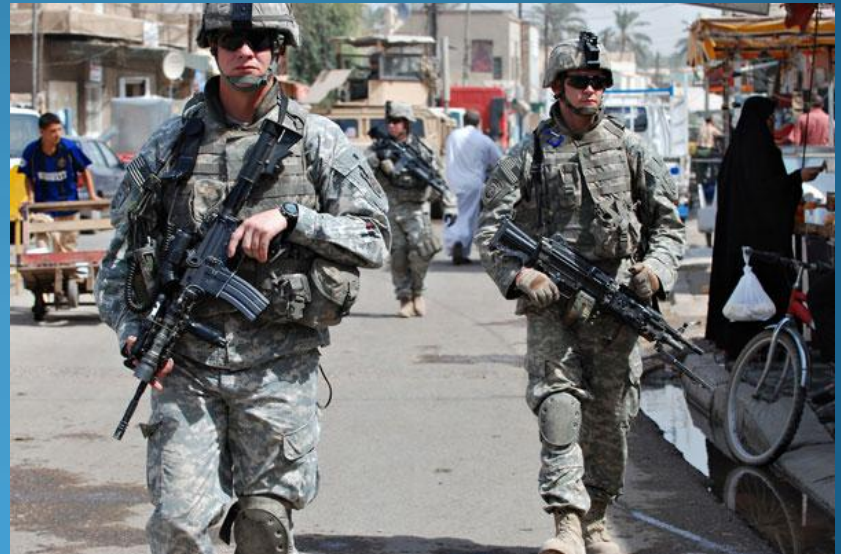
Baghdad, Iraq (army.mil)