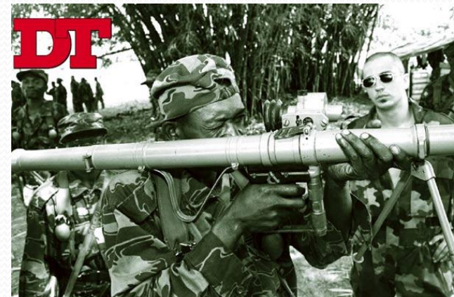
Fotografía de mercenarios en el Zaire.